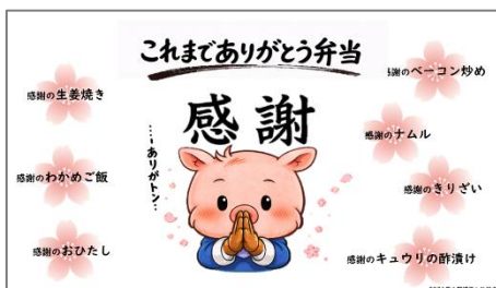
画像2. 新入社員作成メニュー表

「これからよろしく弁当」です。新入社員からの入社式当日限りの特別なお弁当となりますので、ぜひご賞味ください。当日は新入社員のご家族をご招待。10:30から実施の入社式参列後、お弁当を一緒にお楽しみいただきます。