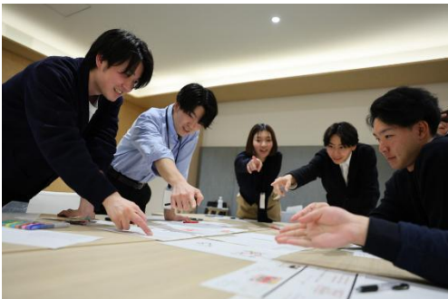
画像1. 新入社員によるお弁当考案の様子

本企画は、新入社員が“ふるさとにありがとう”をテーマに考案する、特別なお弁当プロジェクト。当日はご家族の皆様をご招待し、入社の日出を祝うとともに、感謝を形にする特別な一日を演出します。昨年も大変好評を博し、今年で3回目の開催。地域と共に歩む企業として、新入社員の想いが詰まった“一日限りの特別なお弁当”をお届けします。