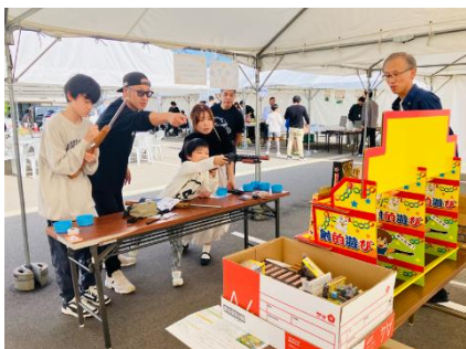
“射的”を楽しむようす

計 3 店舗（おにぎり屋 かみむすび様、ビストロ椿様、ルコト様）の出店となったキッチンカーのコーナーでは、新米で握った美味しいおにぎりや、地元村上牛を使ったハンバーガー、旬のイチジクを使ったデザート、カボチャをふんだん使ったフォカッチャなどが提供されました。縁日コーナーでは、ラジコンによる除雪の疑似体験や、射的、砂絵作成コーナーも！屋内では例年一番人気のプロカメラマンによる家族写真撮影会や、大画面での大人気アクションゲームへの挑戦、で盛り上がりました。