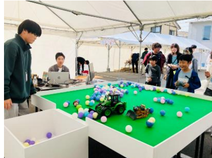
“ラジコン”による除雪体験