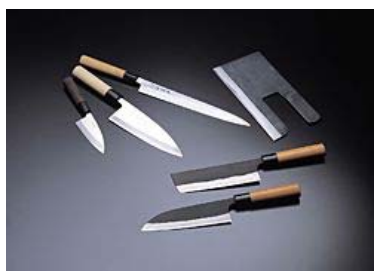
Dao, dụng cụ thủ công truyền thống gần 400 năm