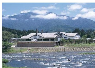
Suối nước nóng và thiên nhiên phong phú