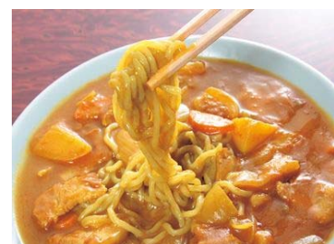
Mì cà ri Sanjo với lịch sử 70 năm