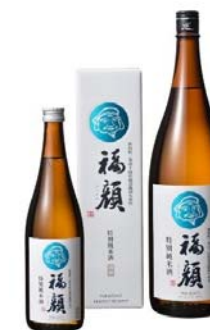
Rượu gạo Niigata